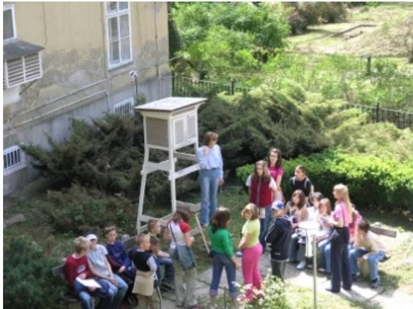
Slika 3. Posjet učenika meteorološkom opservatoriju Zagreb-Grič

Za promicanje meteorologije neobično je važna izdavačka djelatnost ne samo objavljivanje znanstvenih časopisa već i znanstvenih, ali i stručno-popularnih knjiga koje svakome pojedincu mogu približiti tajne vremena i klime. U tu svrhu Društvo posebnu pozornost posvećuje izdavaštvu i to je jedna od najznačajnijih djelatnosti. Od 1990. godine Društvo izdaje znanstveni časopis s međunarodnom recenzijom Hrvatski meteorološki časopis koji je nastavak stručnog časopisa Rasprave i prikazi iz 1956. odnosno od 1982. znanstvenog časopisa Rasprave preuzet od Državnoga hidrometeorološkog zavoda. Od kada je izdavanje Časopisa preuzelo Društvo povećan je broj radova na engleskom jeziku, u recenzentski postupak uključeni su priznati stručnjaci iz inozemstva, te povećana je i međunarodna razmjena. U zamjenu za Časopis stiže 50 svezaka domaćih časopisa iz područja prirodnih znanosti i 60 inozemnih meteoroloških časopisa iz 11 zemalja, a šalje se na 150 inozemnih i 250 domaćih adresa. Jedna od važnih razmjena je s Kongresnom knjižnicom iz Washingtona u čijoj razmjeni redovito stižu knjige iz područja meteorologije i matematičko-prirodnih znanosti.